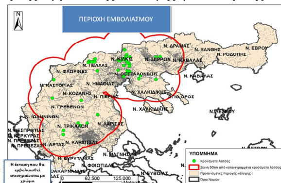
Χάρτης 1. Χάρτης Εμβολιακής Κάλυψης φθινοπωρινής καμπάνιας 2017